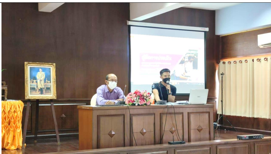
โครงการอบรมคุณธรรมและความโปร่งใสในการดำเนินงานของสถานศึกษา