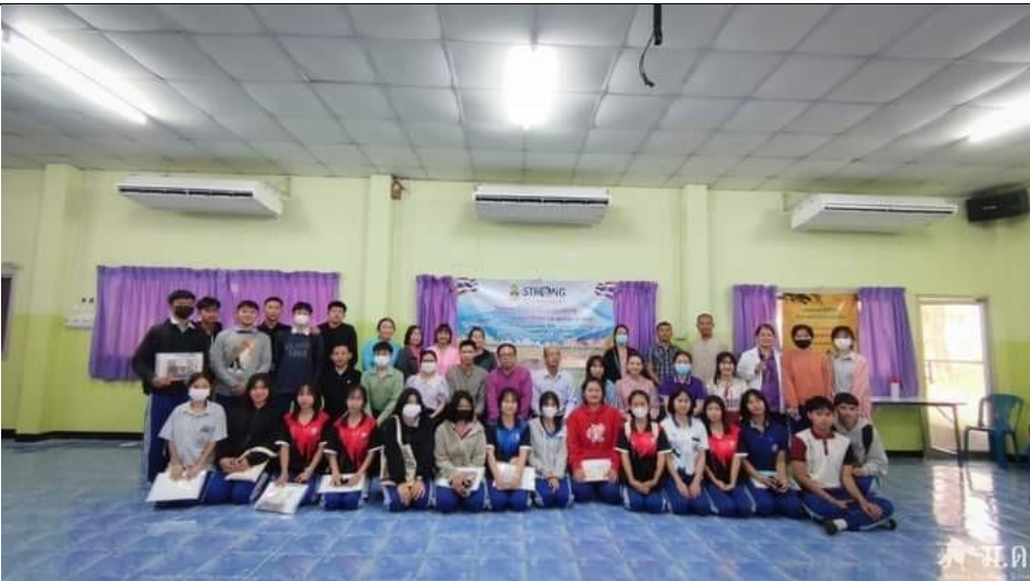
โครงการอบรมสัมมนาเชิงปฏิบัติการ “คณะกรรมการชมรม STRONGๆ และนักเรียน นักศึกษา บุคลากรทางการศึกษาแม่ฮ่องสอนรู้ทันและเฝ้าระวังการทุจริต ๒๕๖๖”